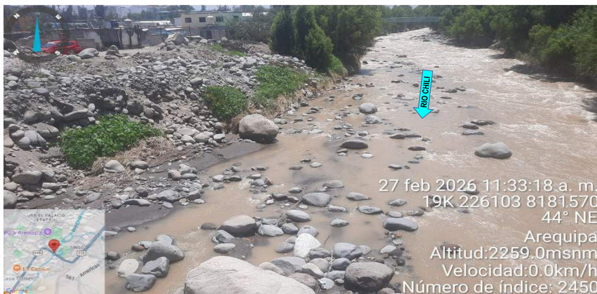
FIGURA N°02: SE OBSERVA LA MARGEN DERECHA AGUAS ARRIBA; QUE SE REQUIERE DE PROTECCION A LAS VIVIENDAS; ANTE POSIBLES DESBORDES E