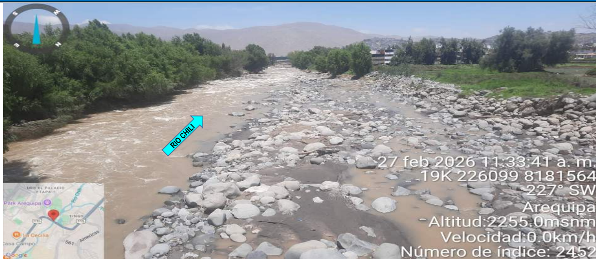
FIGURA N°01: SE MUESTRA AGUAS ABAJO, MARGEN DERECHA DEL RIO CHILI, QUE SE ENCUENTRA COLMATADO CON MATERIAL PROPIO, SIN PROTECCIÓN A LOS CULTIVOS; Y CON UN INCREMENTO DE CAUDAL DEL RÍO CHILI.